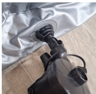
Opzetstuk in ventiel van randen