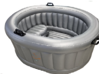
MiaVia Tranquility 2-persoons