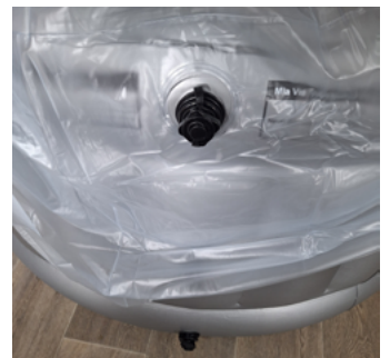
Uitsparing ventiel in de bevalhoes

* Wij adviseren om het bevalbad tijdens de bevalling enkel onder toezicht van een verloskundige/medisch specialist te gebruiken. Het bevalbad mag, vanuit hygiënisch oogpunt, niet gebruikt worden voor andere doeleinden.