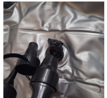
Opzetstuk over ventiel van de bodem en zitje